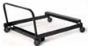
Carrello impilabilità. Stackable trolley.

Braccioli nero/cromato con tavoletta. Black/chromium armrests, with writing tablet.