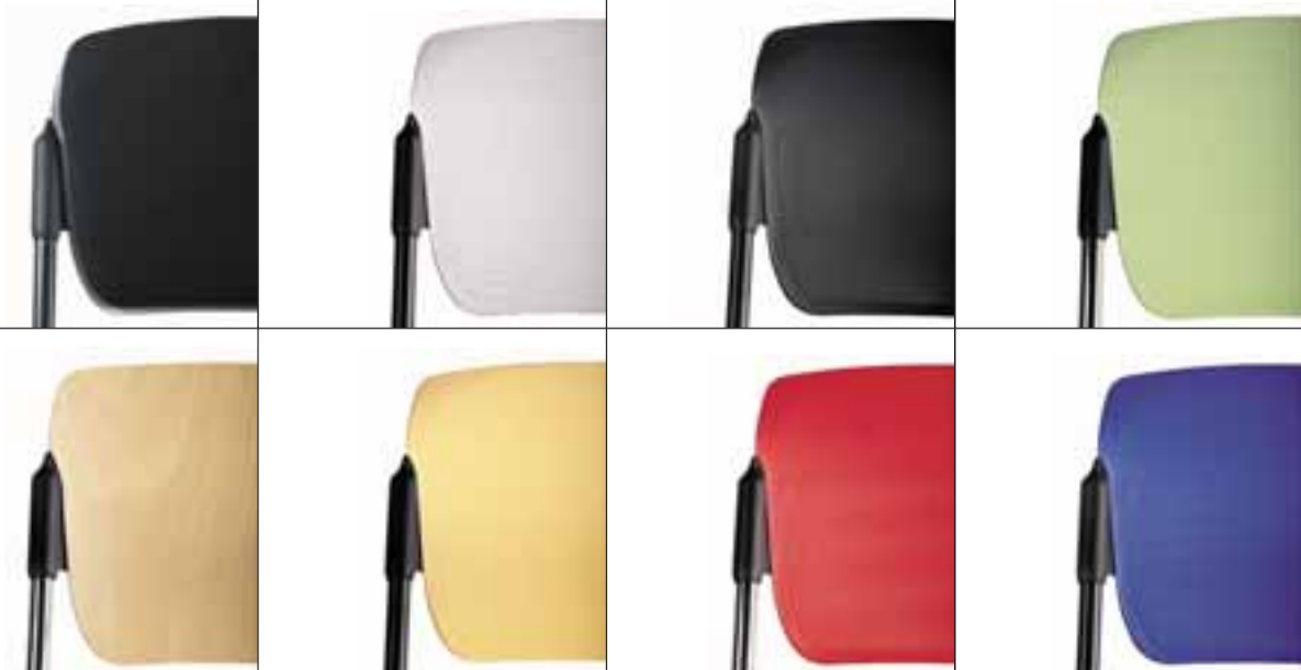
Schienale in polipropilene in 6 colori. Polypropylene back in 6 colors.

Schienale in legno naturale. Back in natural wood.