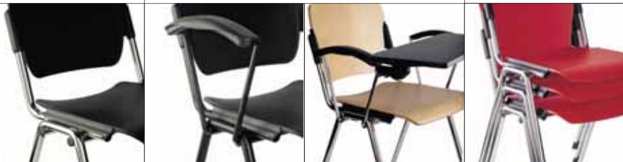
Tavoletta per scrittura. Writing tablet.